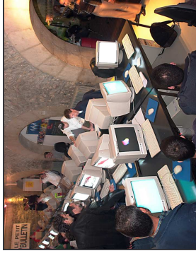
Samedi, minuit : la cloche sonne la fin des hostilités...