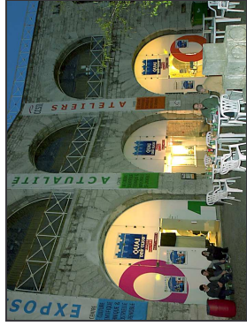
La GWS, c'est au CCSTI de Grenoble

→ La première édition de la GWS s'est déroulée en mars 2001, au Quai des clics, CCSTI-Grenoble. 10 équipes soit 25 candidats ont concouru. Le grand public était au rendez-vous puisque le Quai des clics était plein tout au long du week-end !