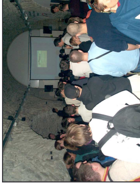
Le lendemain, le public découvre les sites sur grand écran.