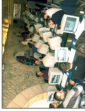
Vue d'ensemble de l'arène des gladiateurs du web.