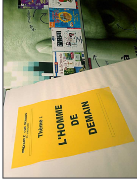
A vos marques, prêts, partez ! Samedi midi, le thème est dévoilé.